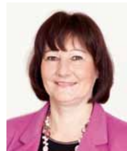
VIZEBÜRGERMEISTERIN HELGA REISENAUER

Die Sonne scheint, die Blumen sprießen, Sträucher und Bäume werden geschnitten, die warme Jahreszeit lockt förmlich die Besitzer in ihre Gärten, wo eifrig gearbeitet wird oder eventuelle Sanierungsarbeiten durchgeführt werden. Zur Verbesserung des örtlichen Gemeinschaftslebens möchte Ihnen die Gemeinde Münchendorf die Lärmverbote im Wohngebiet in Erinnerung rufen: