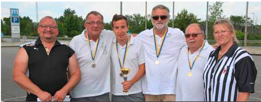
Münchendorfer Stockschützen v. l. n. r.:

Bei der Bezirksmeisterschaft am 4. Juni 2016 in Schwechat haben die Münchendorfer Stockschützen den 2. Platz erreicht und sich damit den Aufstieg in die Gebietsliga gesichert. Ein beachtlicher Erfolg, da dies die erste Teilnahme an der Bezirksmeisterschaft auf Asphalt war. Wir gratulieren der „Einser Mannschaft“ zu dieser Leistung.