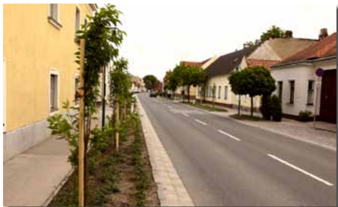
Hauptstraße mit Säulenzierkirschen und Bodendeckerrosen